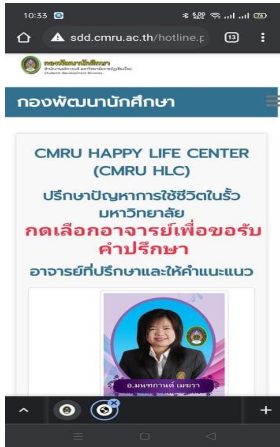
ขั้นตอนที่ 3