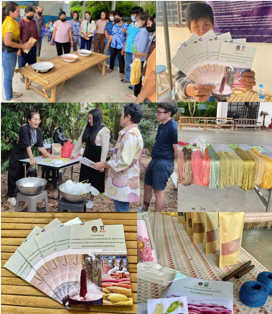
ภาพที่ 2 ผู้ประกอบการเครือข่ายสิ่งทอได้ศึกษาความรู้จากหลักสูตรฯ และได้ใช้ผงสีย้อมธรรมชาติจากวัสดุเหลือทิ้งในชุมชน (ผู้ใช้ประโยชน์โดยอ้อม)

2. ผู้ใช้ประโยชน์โดยอ้อม คือ ผู้ประกอบการเครือข่ายสิ่งทอได้ศึกษาความรู้จากหลักสูตรการฝึกทักษะการย้อมสีธรรมชาติด้วยตนเอง รวมถึงผู้บริโภคที่จะได้ใช้ผลิตภัณฑ์ที่เป็นมิตรกับสิ่งแวดล้อมจากวัสดุเหลือทิ้งในชุมชนท้องถิ่นเพื่อสร้างมูลค่าเพิ่มให้กับผลิตภัณฑ์สิ่งทอ