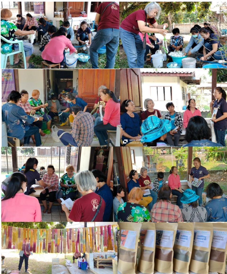
ภาพที่ 1 การใช้หลักสูตรฝึกทักษะการย้อมสีธรรมชาติ (ผู้ใช้ประโยชน์โดยตรง)

1. ผู้ใช้ประโยชน์โดยตรง คือ ชุมชนบ้านป่าห้าและชุมชนใกล้เคียง นำโดยกลุ่มวิสาหกิจชุมชนจุไรรัตน์ผ้าฝ้ายสามารถนำองค์ความรู้ที่ได้รับจากหลักสูตรฝึกทักษะการย้อมสีธรรมชาติจากวัสดุเหลือทิ้งในชุมชนไปประยุกต์ใช้ในกลุ่มวิสาหกิจของตนเองได้อย่างมีประสิทธิภาพ เพื่อพัฒนาคุณภาพสีย้อมธรรมชาติสำหรับงานปักให้ได้มาตรฐานผลิตภัณฑ์ชุมชน