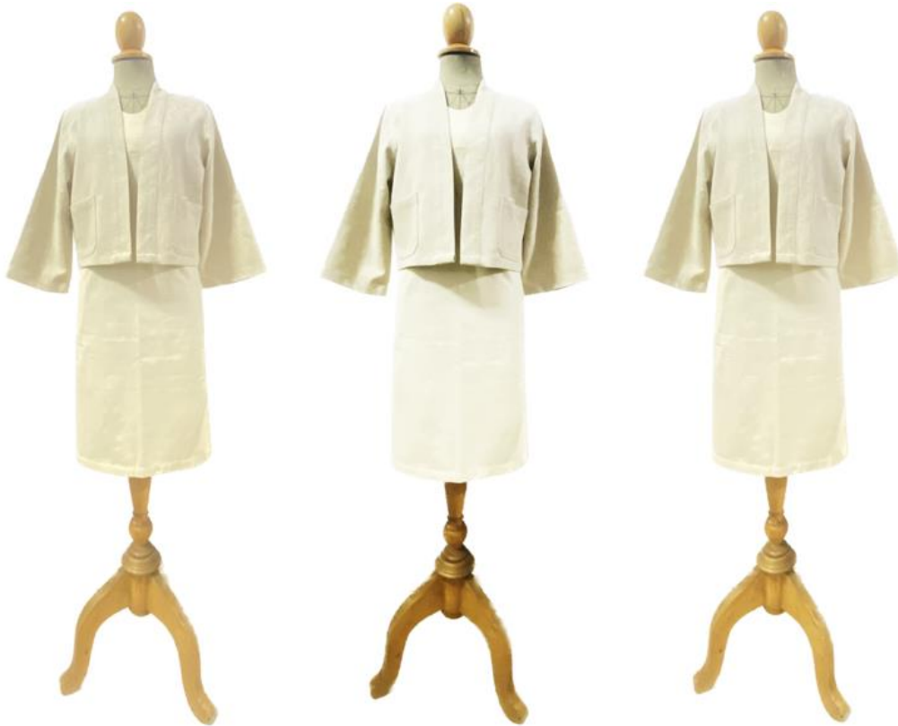
ภาพที่ 4 ต้นแบบผลิตภัณฑ์ที่ยื่นขอรับรองมาตรฐานผลิตภัณฑ์ชุมชน (มผช.)

ชุมชนเป้าหมายสามารถนำผลิตภัณฑ์ต้นแบบย้อมสีธรรมชาติจากผงสี้อมฝักฉำฉาที่เกิดจากการวิจัยไปยื่นขอรับรองมาตรฐานผลิตภัณฑ์ชุมชน (มผช.) เพื่อขยายฐานตลาดของผู้บริโภคทั้งในและต่างประเทศ และยังสามารถต่อยอดเพื่อสร้างผลิตภัณฑ์ใหม่ที่จะช่วยสร้างมูลค่าเพิ่มให้กับผลิตภัณฑ์ ลดรายจ่าย อันจะส่งผลต่อการเพิ่มขึ้นของรายได้และการพัฒนาคุณภาพชีวิตของคนในชุมชนให้มีความเป็นอยู่ที่ดี