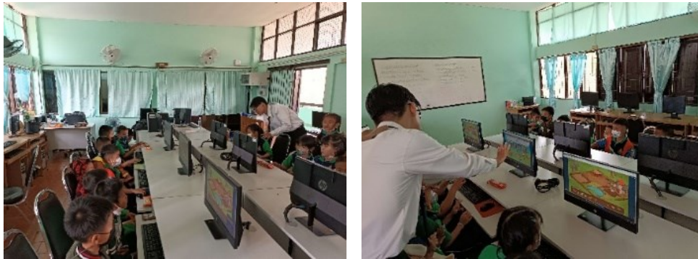
ภาพที่ 3 การทดลองใช้สื่อการเรียนรู้อิเล็กทรอนิกส์ผ่านระบบเมตาเวิร์ส

จากการวิเคราะห์ข้อมูลผลจากการทดลองใช้สื่อการเรียนรู้อิเล็กทรอนิกส์ผ่านระบบเมตาเวิร์ส เป็นเวลา 2 ชั่วโมงได้ผลสัมฤทธิ์ทางการเรียนรู้ดังนี้