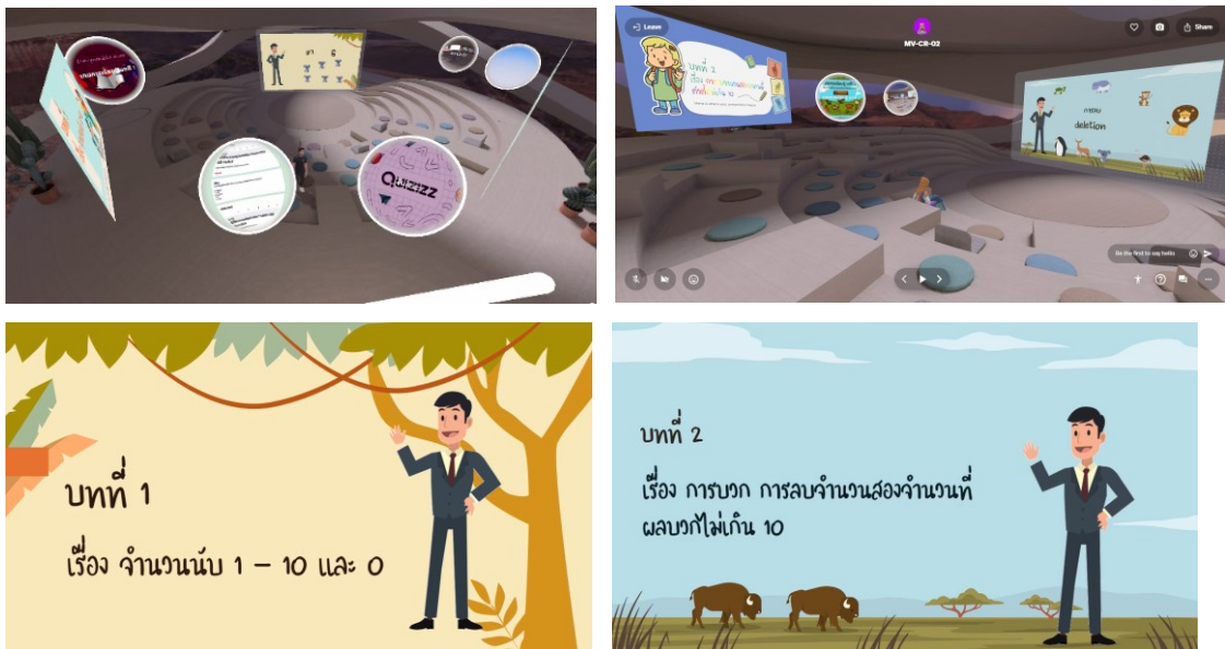
ภาพที่ 1 แสดงสื่อการเรียนรู้อิเล็กทรอนิกส์ผ่านระบบเมตาเวิร์ส

จากการพัฒนาสื่อการเรียนรู้อิเล็กทรอนิกส์ผ่านระบบเมตาเวิร์สมีผลการดำเนินงาน ดังนี้