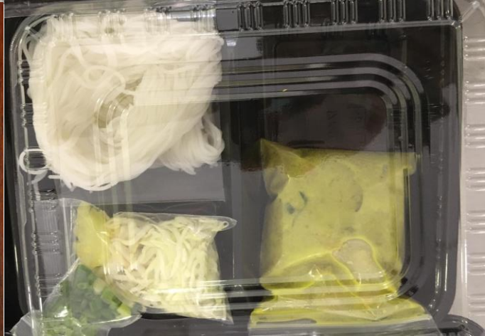
ภาพตัวอย่างผลิตภัณฑ์และการจัดกิจกรรม ณ โรงงานต้นแบบแปรรูปผลผลิตทางการเกษตร