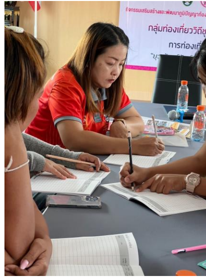
- ภาพถ่ายสมุดบัญชีรับจ่ายที่มีการจดบันทึกเรียบร้อยแล้ว 1-2 ภาพ