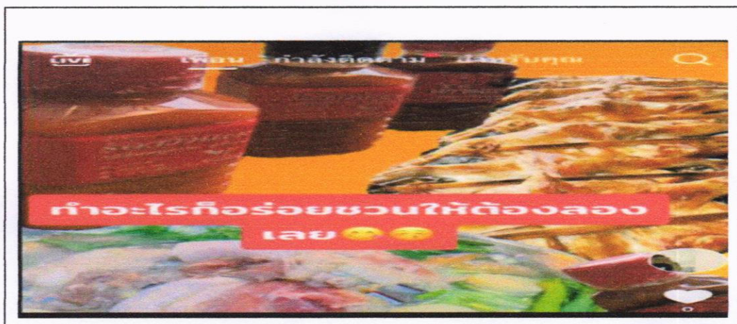
ภาพที่ 2 รูปแบบการโฆษณาและประชาสัมพันธ์น้ำจิ้มสุกี้รื่องวัวแดงโดยใช้การตลาดสมัยใหม่

2. เพิ่มช่องทางการสร้างรายได้ให้กับคนในชุมชนจากการบูรณาองค์ความรู้ด้านการตลาดสมัยใหม่