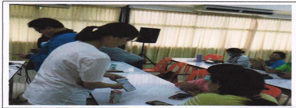
ภาพที่ 1 การทดลองใช้การตลาดสมัยใหม่ผ่านโทรศัพท์ของตนเอง