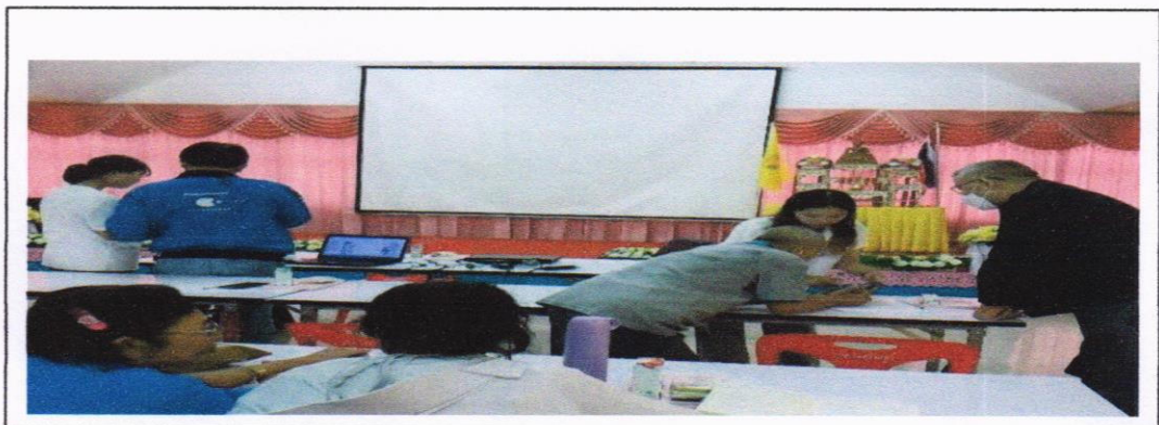
ภาพที่ 2 การสร้างองค์ความรู้ เพิ่มรายได้ สร้างอาชีพให้ผู้สูงอายุจากการตลาดสมัยใหม่