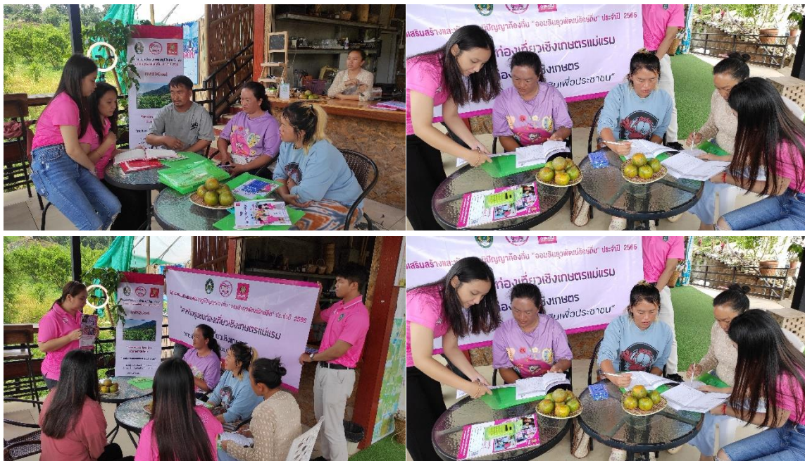
การลงพื้นที่ดำเนินกิจกรรมโครงการ