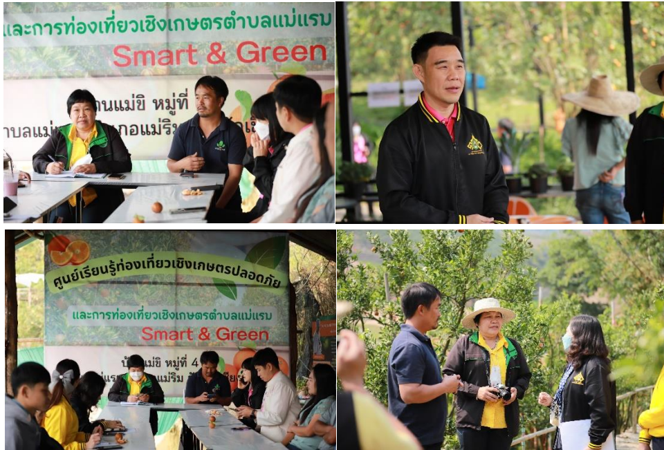
การประชุมร่วมกับเกษตรกรอำเภอแม่ริม กลุ่มวิสาหกิจชุมชน ตัวแทนธนาคารอมสินภาค 8 ตัวแทนธนาคารอมสินสาขาแม่ริม และคณาจารย์ นักศึกษา มหาวิทยาลัยราชภัฏเชียงใหม่