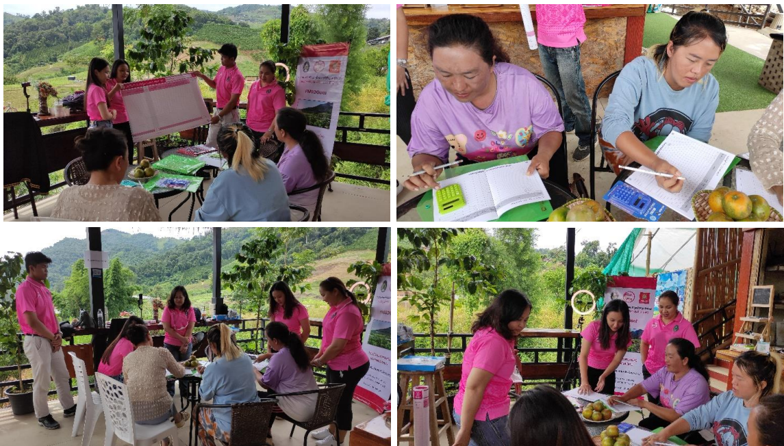
การให้ความรู้การจัดทำบัญชีต้นทุน บัญชีครัวเรือน