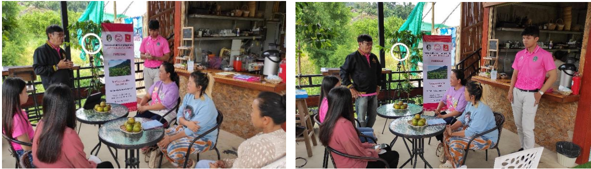
การให้ความรู้เทคนิคและการใช้อุปกรณ์การ Live สด ผ่านสื่อสังคมออนไลน์