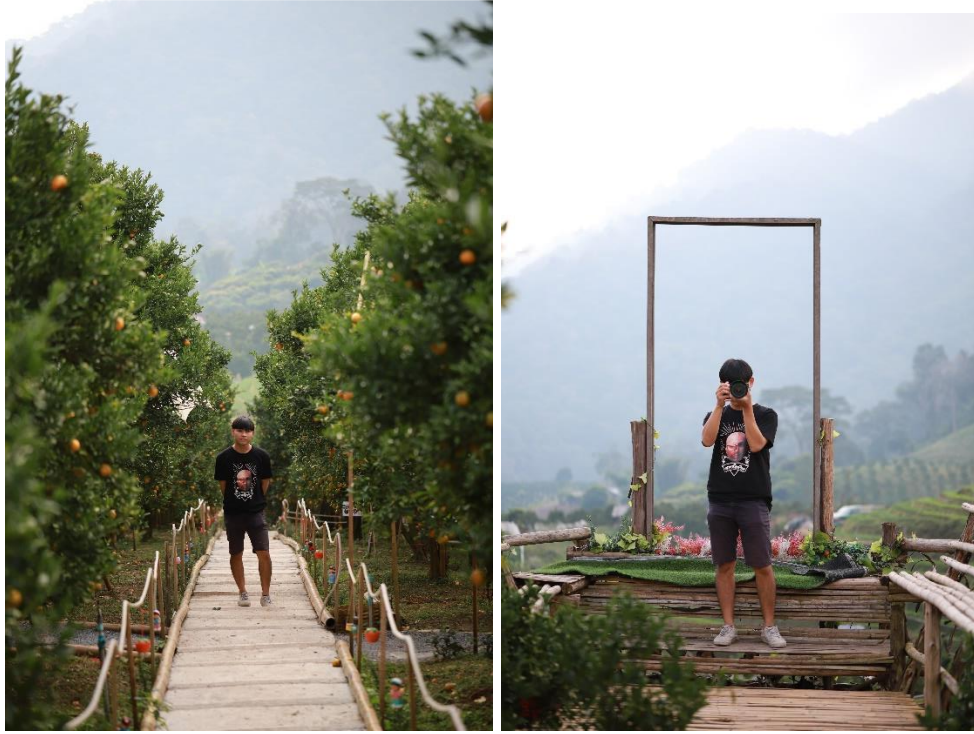
บรรยากาศการดำเนินโครงการและสถานที่ท่องเที่ยวเชิงเกษตรของสมาชิก กลุ่มวิสาหกิจชุมชนท่องเที่ยวเชิงเกษตร